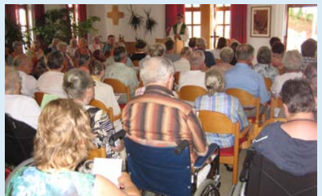
Gäste und Besucher bei der Einweihungsfeier und beim ökumenischen Gottesdienst als Auftakt zum Sommerfest Interessierte Besucher in einem neuen Pflegezimmer