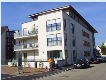
Straßenansichten: Ziegelei- und Stettiner Straße